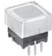
JB 发光触觉 LED 的更改

JB 发光触觉将更改为红色、黄色和绿色 LED 规格。上述更改无论在标准或惯例上对所有发光模型均有效。规格更改如下概述，接着是生效的标准零件号。