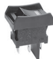
JWS 点发光翘板 LED 的更改

JWS 点发光翘板将更改为红色、琥珀色和绿色 LED 规格。上述更改无论在标准或惯例上对所有发光模型均有效。规格更改如下概述,接着是生效的标准零件号。