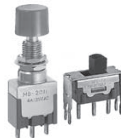
MB 按钮和 MS 滑动开关的更改

EB 和 MB 按钮和 CS 和 MS 滑动开关的生产区域将由中国厂家变更为菲律宾厂家。开关箱侧面的批号在第二位数上带有点标记,而不是在第一位数上。开关的包装箱上印有“PHILIPPINES FACTORY”而不是“CHINA FACTORY”。所有这些更改将适用于定制和标准产品。