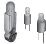
选定 AT600 灯具及 LED 的更改