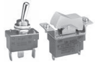
S 摇头和 SW 翘板

S 摇头和 SW 翘板的生产区域将由日本厂家变更为菲律宾厂家。生产厂家名称和地址不再标示于开关底部。开关箱侧面的批号在第二位上带有点标记。开关的装运包装箱上印有“PHILIPPINES FACTORY”而不是“JAPAN FACTORY”。所有这些更改适用于定制标准产品、定制产品和 UL/CSA 认可的产品。