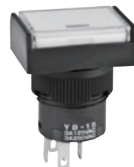
YB 系列点状发光按钮

提供 YB 系列点状发光 LED 灯按钮的制造商已变更。更换的红色或琥珀色指示灯为 2 伏特 (无电阻)；红色、琥珀色或绿色灯为 5 伏特；琥珀色灯为 12 伏特；绿或红绿双色灯为 24 伏特。