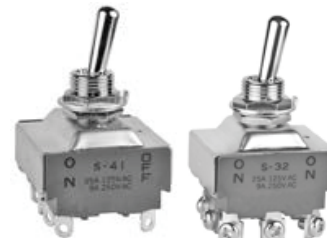
S30 系列和 S40 系列摇头开关

1. S30 系列和 S40 系列摇头开关的生产更改。产品上不再出现产地，NKK 标志将被更新。开关批号上的第一位数字上有点标记。设备运输包装箱上印有“PHILIPPINES FACTORY”，而非“JAPAN FACTORY”。这些更改适用于所有标准产品，定制产品和一些标准认证产品。受影响的标准件号如下。