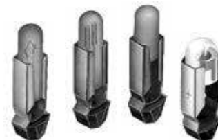
AT600 白炽灯、氙灯和 LED 的更改

一些 AT600 白炽灯, 氙灯和 LED 将会发生变化。灯座底座的材料正在从酚醛树脂变为玻璃纤维增强聚酰胺。不再显示 NKK 标识, 即灯座底部的标识。这些修订将适用于下面特别列出的标准 AT 部件号, 并包括自定义 AT 部分。