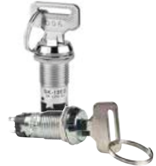
SK 低和中安全性钥匙锁开关

1. SK 低和中安全性钥匙锁开关的地址和生产更改。产品上不再出现产地，NKK 标志将被更新。开关批号上的第一位数字上有点标记。设备运输包装箱上印有“PHILIPPINES FACTORY”，而非“JAPAN FACTORY”。所有这些修订将适用于标准，定制和 UL / CSA 认可的产品。下表中列出了 SK 的有效标准零件编号。